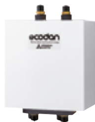
Ecodan 2-piiri kitti PAC-TZ01

* Nimellisteholla, ulkolämpötila +7°C, menovesi +35°C